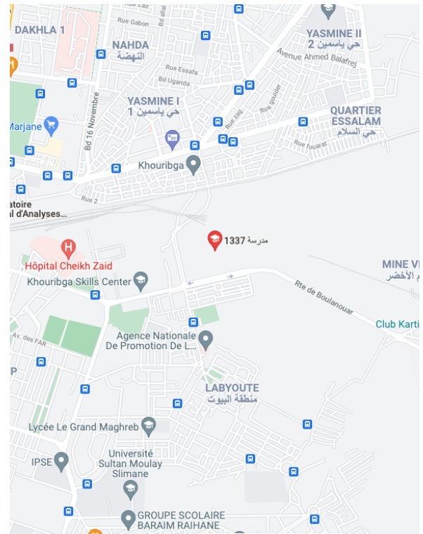
Lieu du stage : Le Lab de 1337 Mail Central, 25000, Khouribga, Maroc

Vous avez envie de relever des défis et mettre votre enthousiasme au service d'une entreprise qui saura vous proposer une prise de responsabilités rapide ?